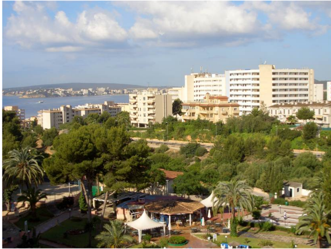
Figura 1. Calviá, Palma de Mallorca, 2008. Autor: J.M. Barragán.

años (Figura 1), han transformado de forma radical las áreas litorales españolas. Han desaparecido ecosistemas que constituían hábitat críticos para especies de flora y fauna singulares que actualmente se encuentran amenazadas. Esto es así porque han sido ocupadas antiguas lagunas costeras, dunas, marismas, estuarios y desembocaduras; y, en las últimas dos décadas, cualquier tipo de espacio, terreno o ambiente, en los dos primeros kilómetros de la costa.